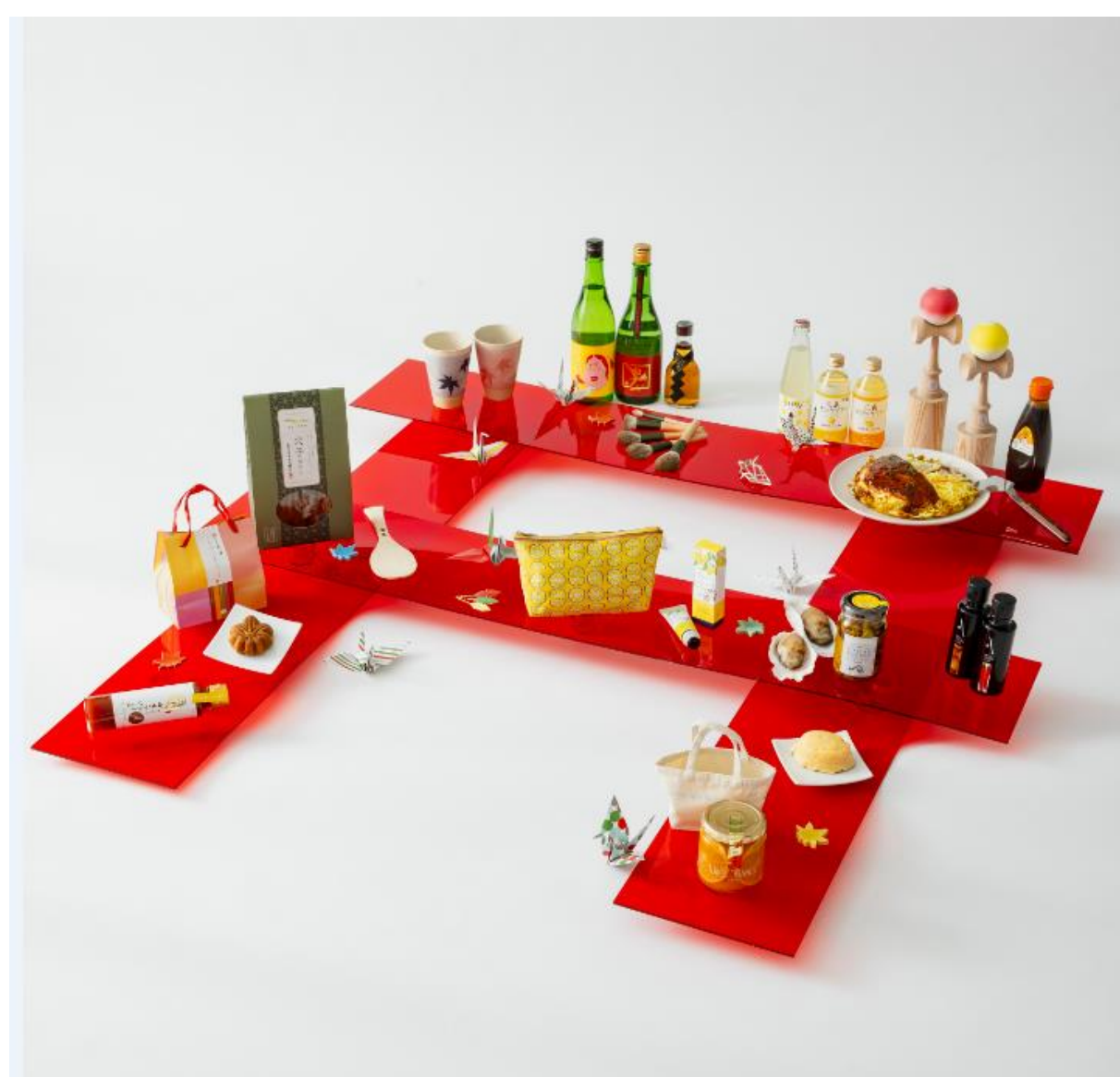
▲ 広島県内を探し巡った「逸品・一品」