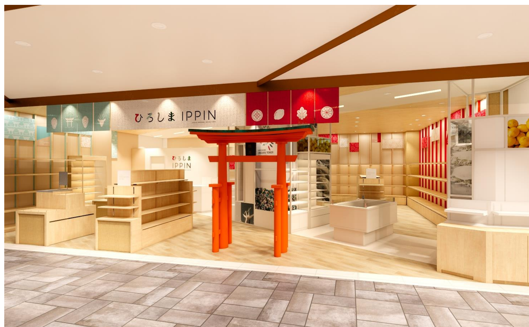
▲ 「ひろしま IPPIN」店舗パース

そしてこの度、新たな挑戦として、大阪に2号店となる旗艦店をオープンする運びとなりました。