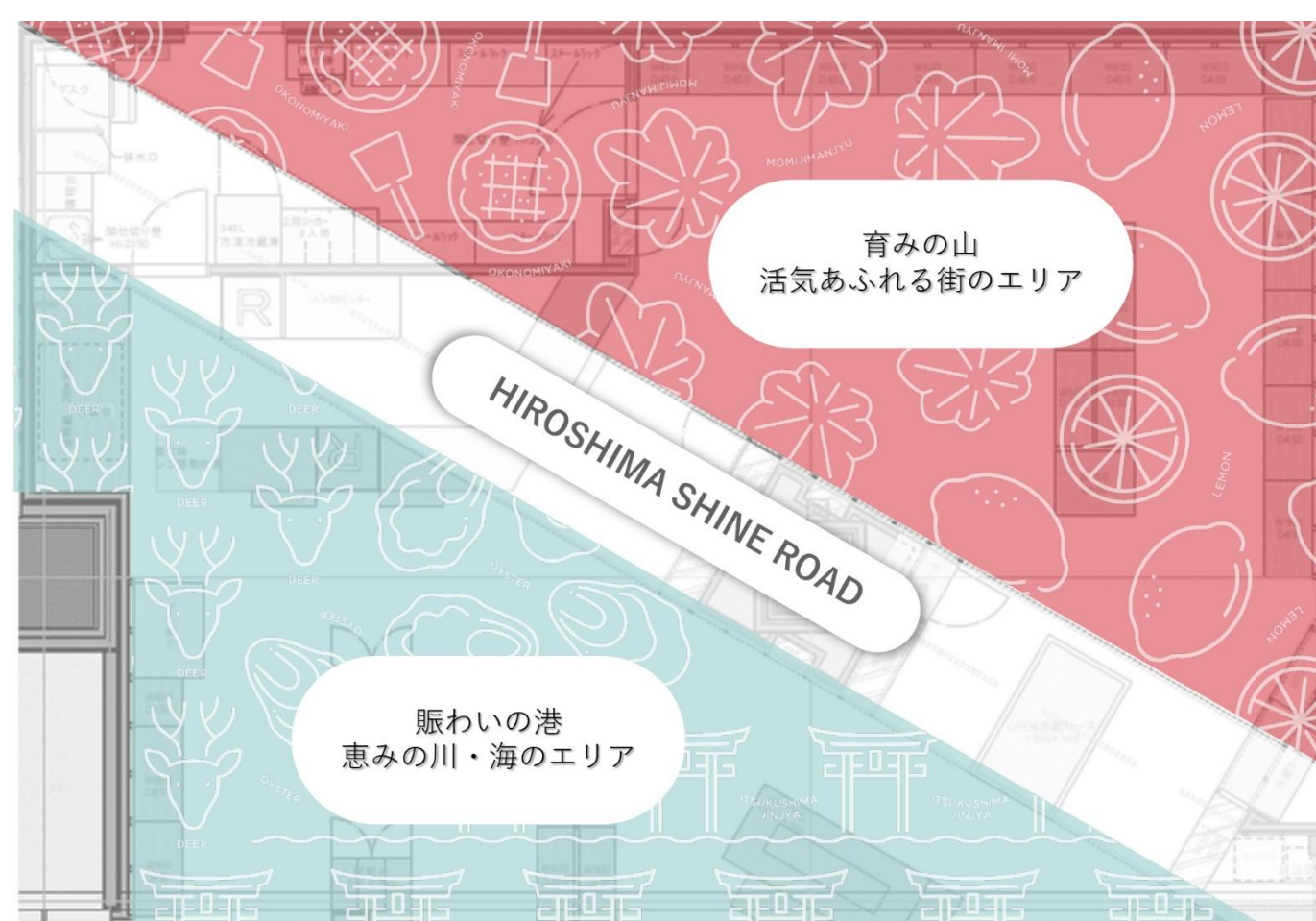
▲ 「ひろしま IPPIN」店舗エリアパース

また、広島を繋ぐ道を表現した白い道は「HIROSHIMA SHINE ROAD」と名付けられ、モダンでシンプルな表現で広島を感じていただく空間に仕上げました。