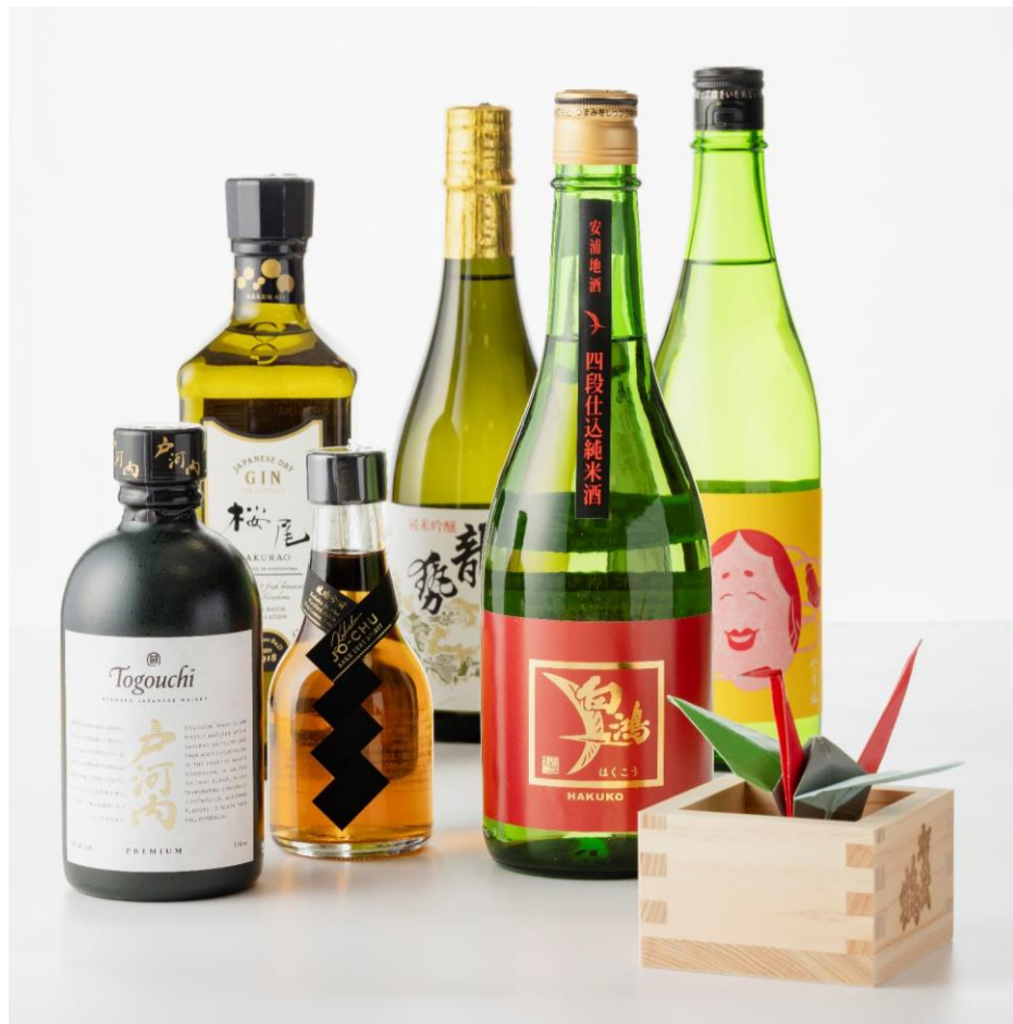
▲ 広島 の 地 酒