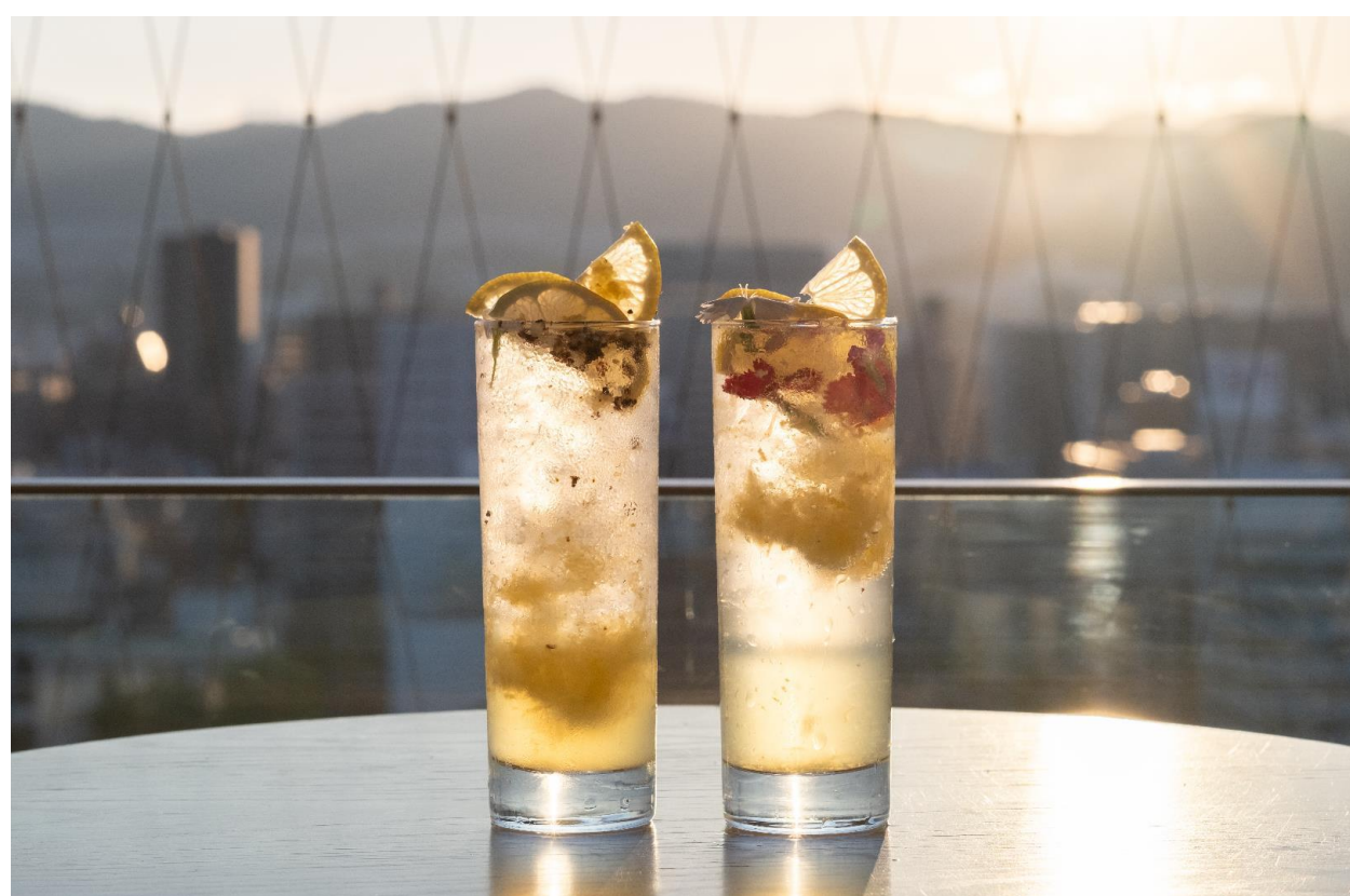
◆お米を原料とした奥飛騨ウォッカを使用した 瀬戸内スパイシーレモンウォッカ（税込1,200円）

その他、お酒が苦手な方でも楽しめるよう、ノンアルコールやカフェメニューを充実させます。今年3月にリニューアルオープンした「Akushu Cafe ORGANIC」で使用しているMOUNT COFFEEオリジナルブレンドのオーガニックコーヒーも夜のカフェタイムに販売。（税込600円～）砂糖・小麦粉・人工甘味料不使用の「Bee'sの生はちみつチーズケーキ」と共にお楽しみいただけます。（税込1,000円）