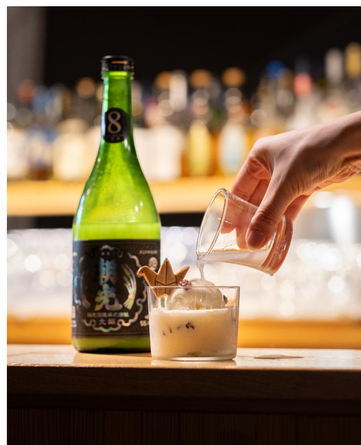
◆ 「朝光どぶろくアフォガード」（税込1,500円）