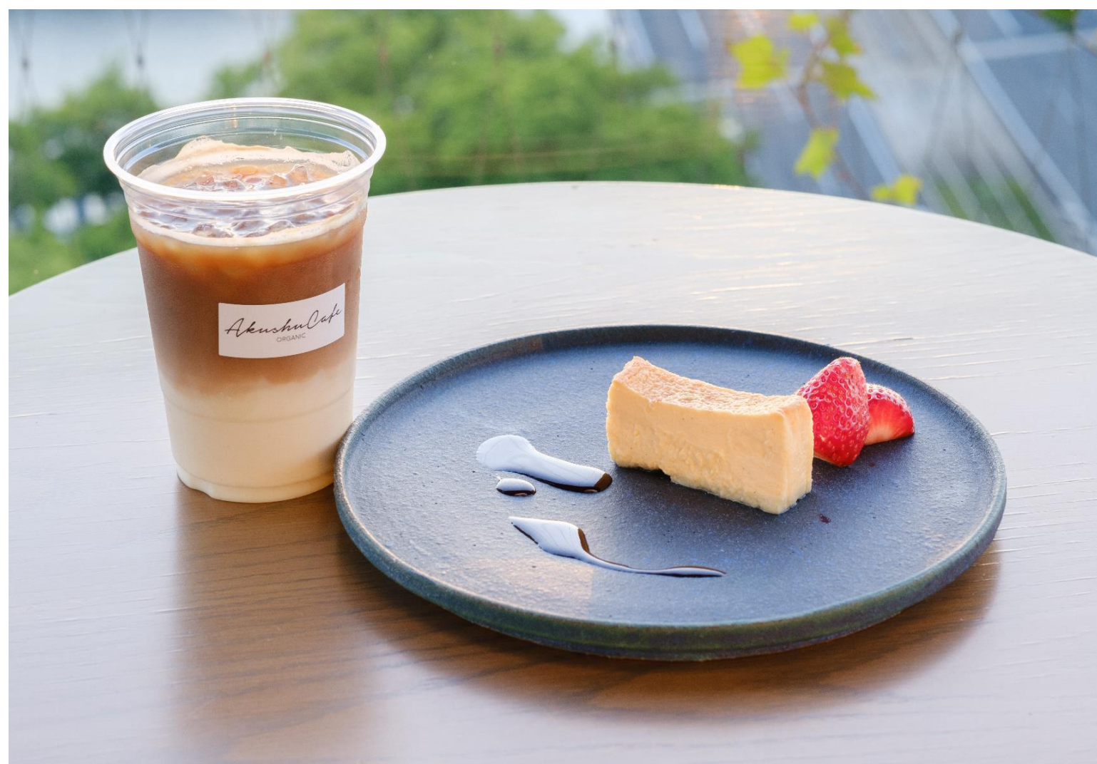
◆豆乳ミルクラテ（税込730円） ◆Bee'sの生はちみつチーズケーキ（税込各1,000円）

いつもの役割から離れ、非日常の中から安らぎを感じられますように。おりづるタワーでしか見られない景色と共にゆっくりとした時間をお過ごしください。