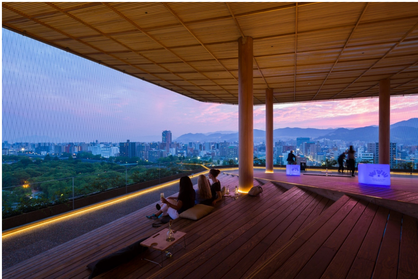
◆屋上展望台からのサンセット