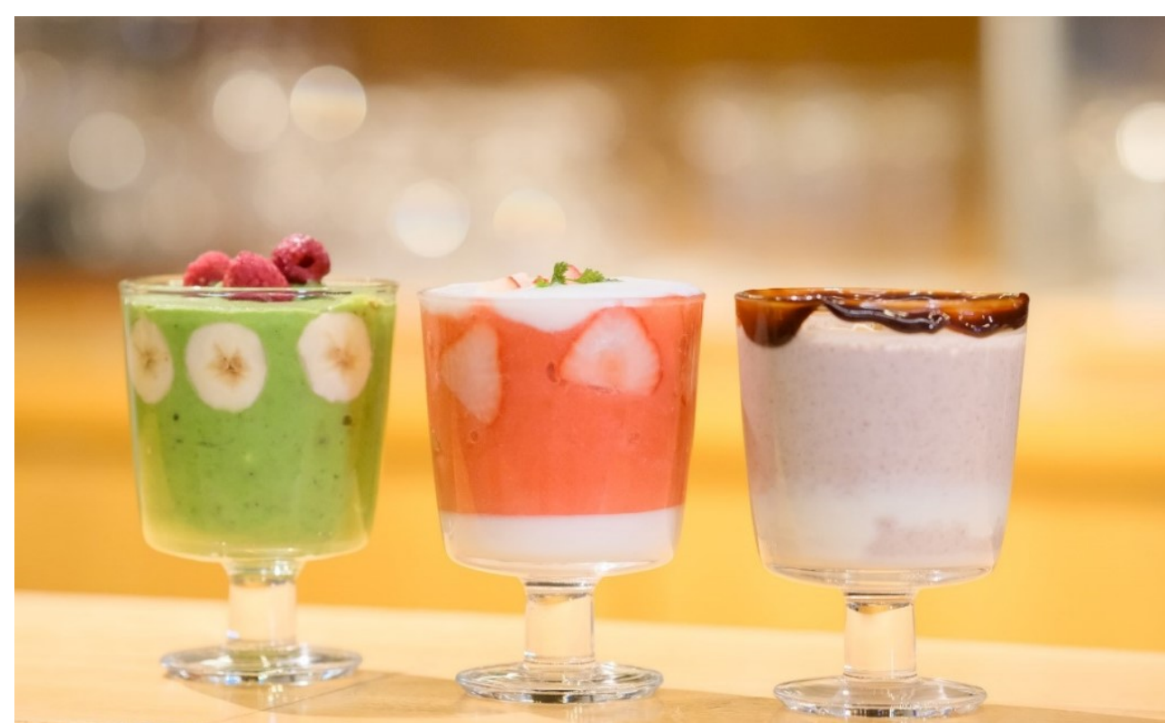
◆左から「陽だまりのグリーンスムージー」「苺とヨーグルトのそよ風スムージー」「ミスター・ソルティナッツ」（税込各1,300円）

また、毎年人気のスムージーカクテルには旬のフルーツをふんだんに使用した定番メニューに加え、野菜、ナッツ、ヨーグルトなどを使用した新感覚のメニューを新たにラインアップ。（税込各1,300円）ノンアルコールに変更も可能で、美味しさだけでなく体にも優しい素材を厳選。リフレッシュしながら、心地よいひとときをお楽しみください。