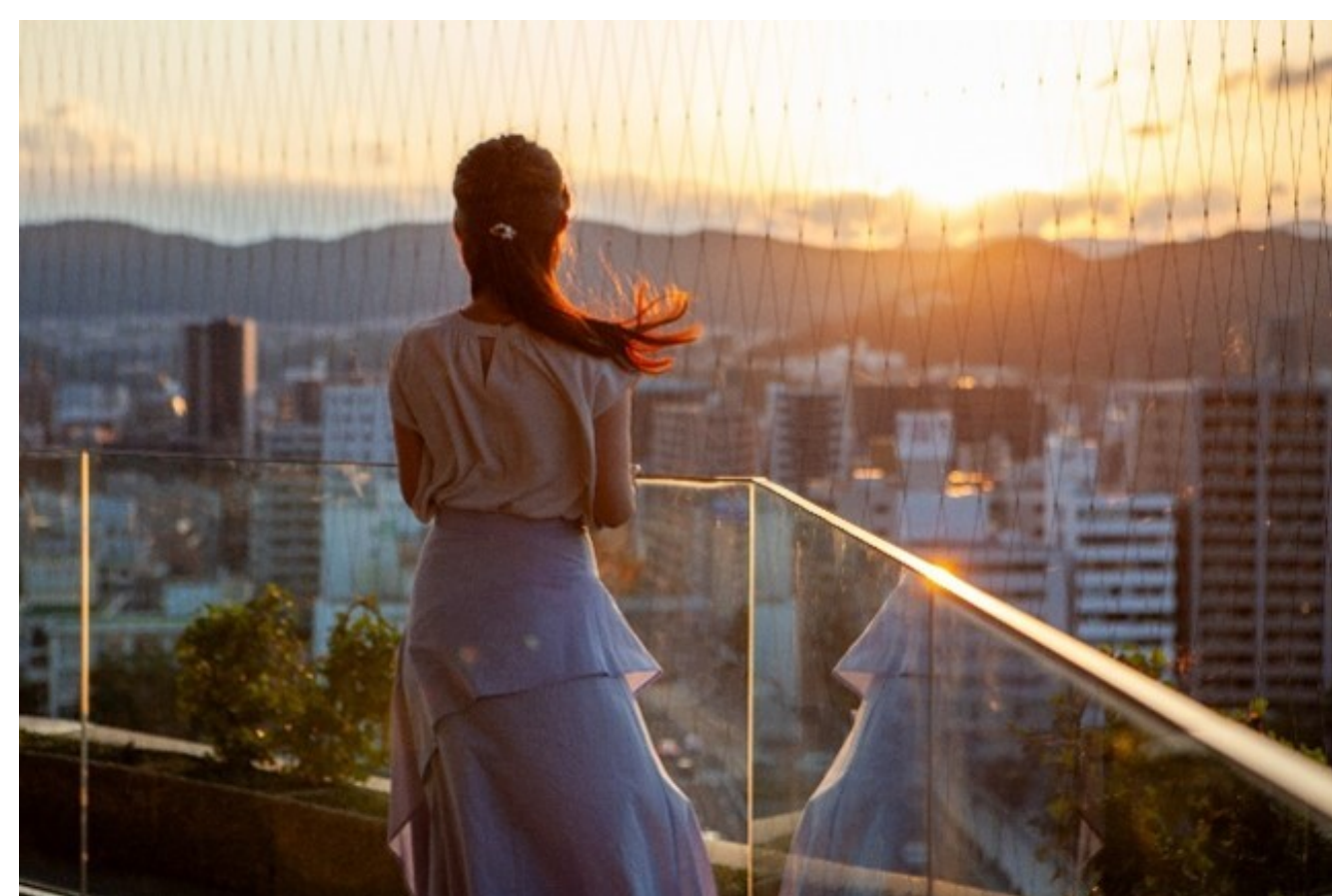
◆屋上展望台からのサンセット