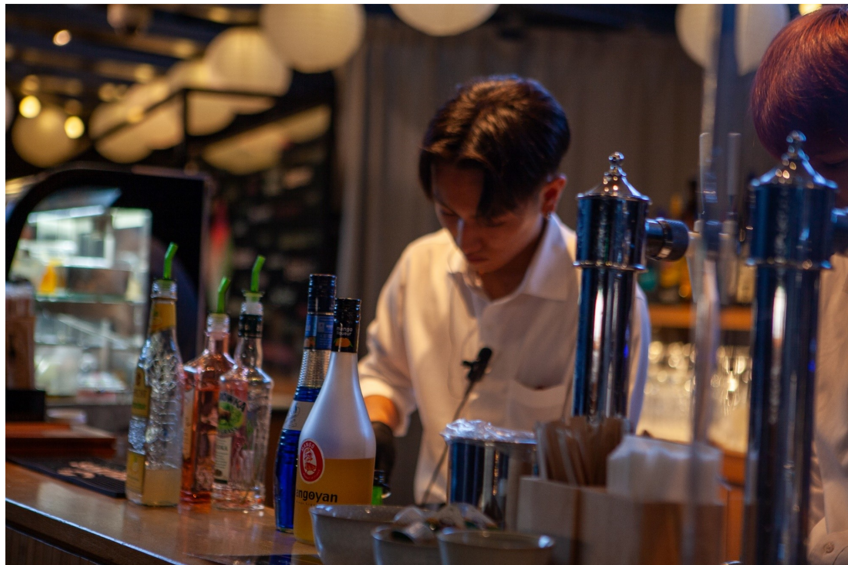
◆ROOF TOP CAFE & BARのカウンター