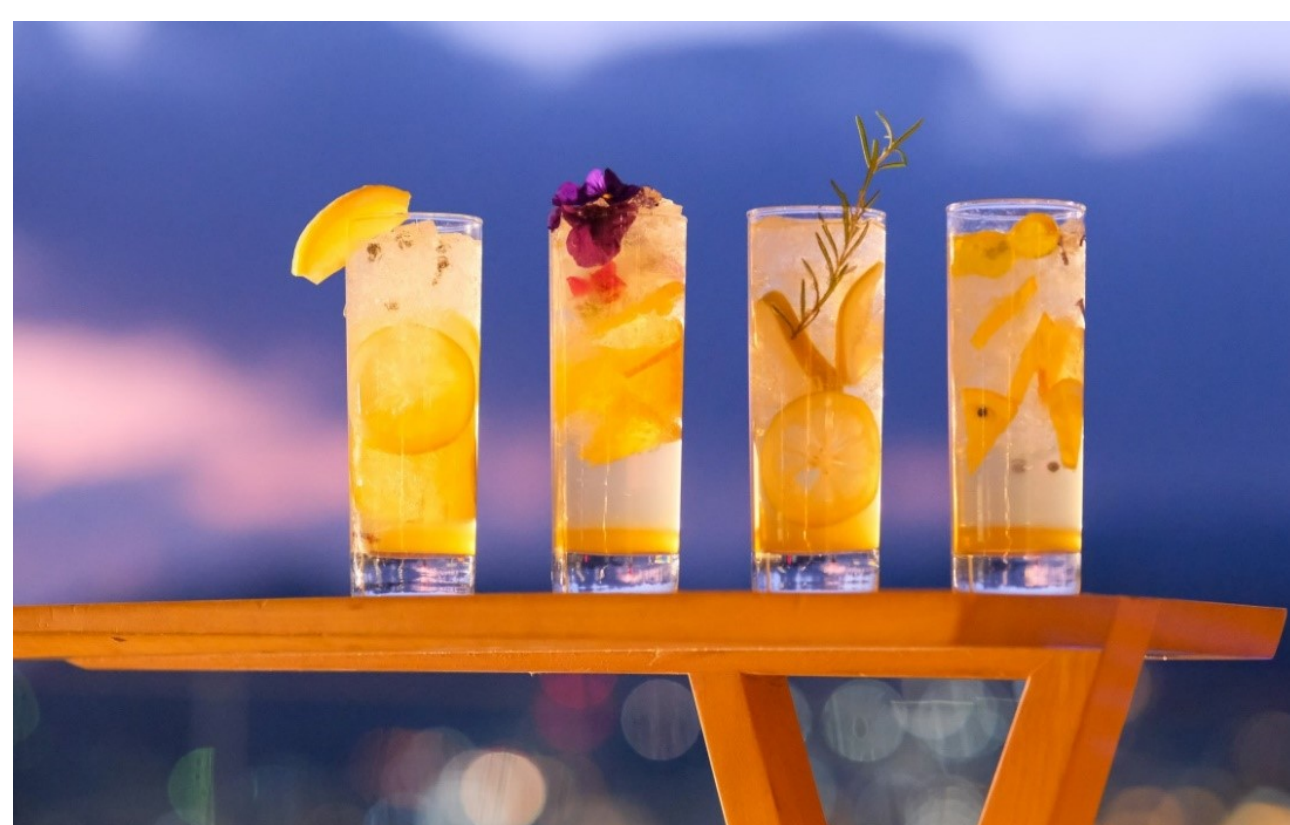
◆「選べる柑橘」（税込1,100円～）