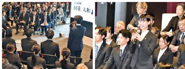
新入社員一人ひとりが、やや緊張気味に自己紹介と決意表明を行いました