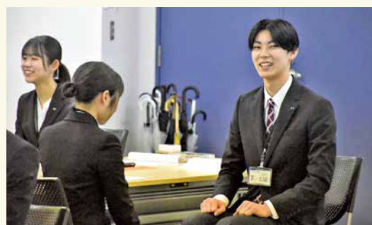
ゲームを通してチーム決めを行い、仲間との連携を学びました