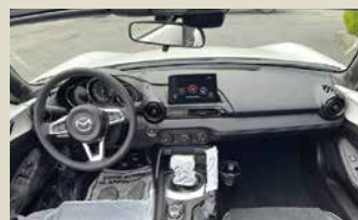
左ハンドル・2000ccで ワンランク上の走り