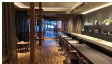
割烹料理 宮島與平