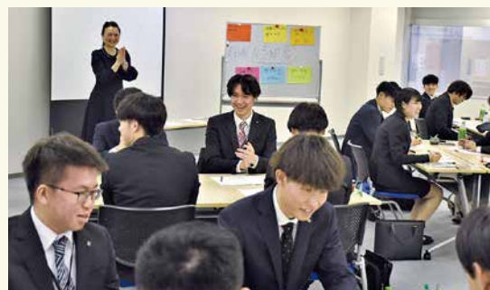
職場のコミュニケーションの大切さや基礎的なマナーについて具体的に学びました