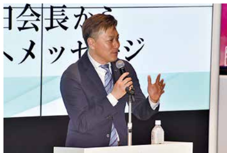
松田会長から歓迎メッセージ