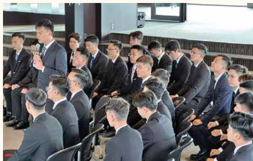
新入社員が一人ずつ決意表明