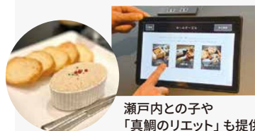
瀬戸内との子や「真鯛のリエット」も提供

特別な時間を過ごすことができる「厳島いろは」。グループ社員の皆様には30%OFFの特典をご用意しています。