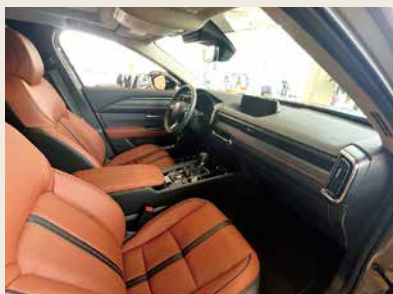
ラグジュアリーで洗練されたインテリア