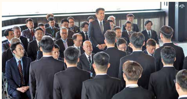
役員・配属先管理職の紹介