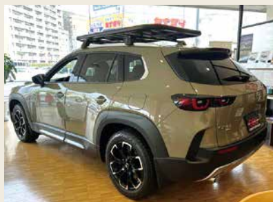
シンプルかつワイド感のあるリアボディ