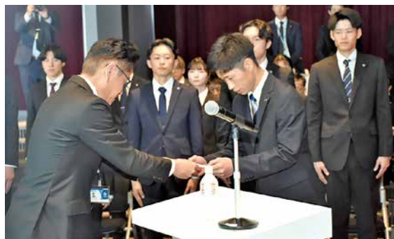
(株)広島マツダ 山根社長から辞令交付