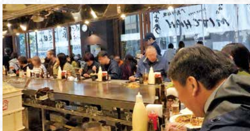
テーブル40席、カウンター16席、テラス18席が終日満席で賑わいました