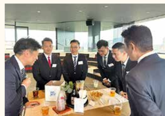
班ごとに分かれて会話を楽しみ、徐々にリラックスして笑い声が響く和やかな懇親会となりました