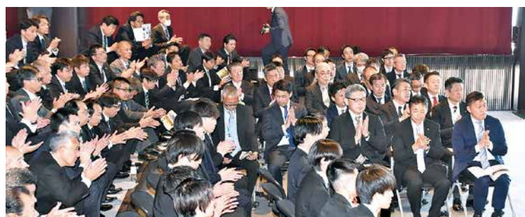
グループ会社役員、管理職が出席