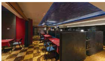
握手レストラン(4月6日オープン)