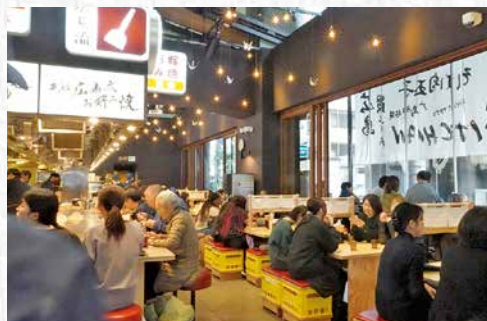
平和記念公園を臨む開放的な空間