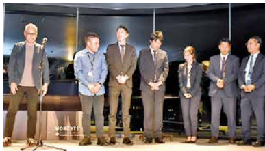
赤井本部長から表彰 （総合7位～10位）