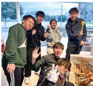
協力してカレー作り