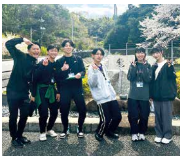
島内に定められたチェックポイントを徒歩で回りました