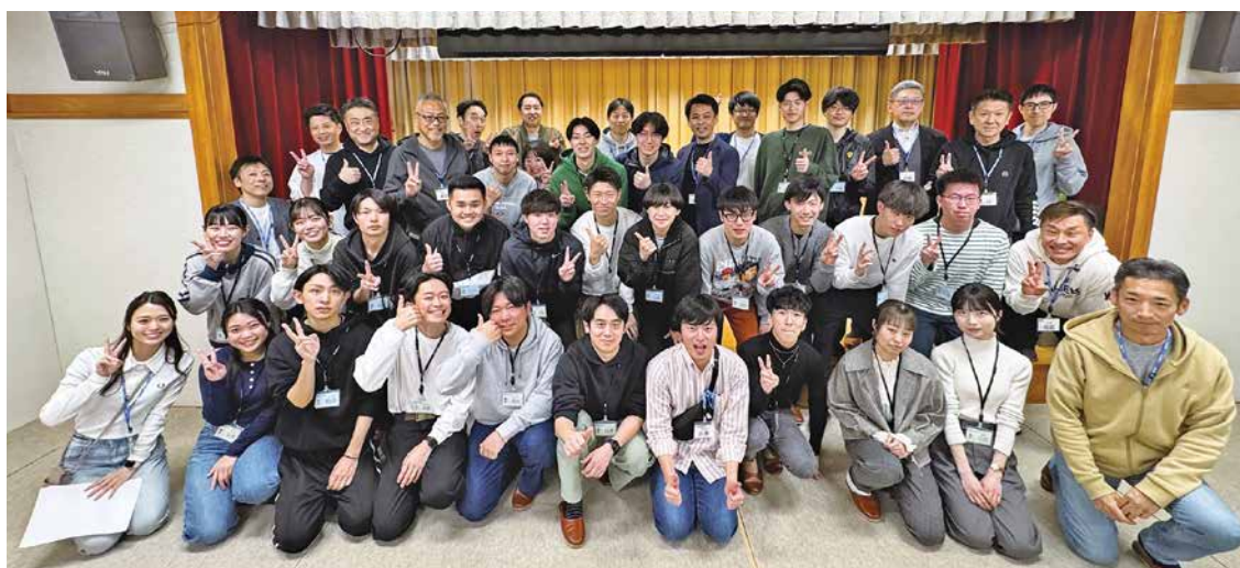
経営陣と触れ合い、同期との絆も深まった研修となりました