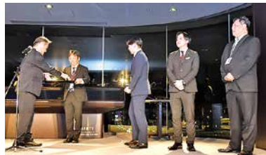
芦谷本部長から表彰 （総合10位以下カテゴリ1位）