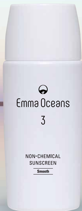
エマ オーシャNZ 3 スムースタイプ [さらさら]

エマ オーシャNZは美容液成分を配合し、 肌に潤いを与えながら紫外線ケアができます。 さらにノンケミカル処方でサンゴ礁・きれいな海を守ります。 ※ノンケミカル：紫外線吸収剤フリー