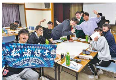
グループワークを通じて皆で大いに盛り上がりました!