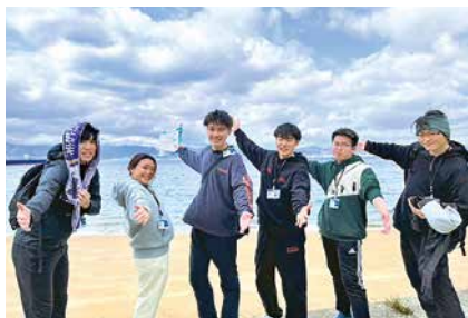
コースや時間設定を役割分担して進みました