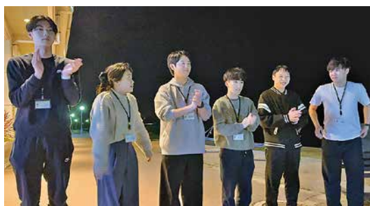
懇親会ではBBQを楽しみ、中間発表も行いました