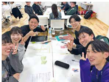
マシュマロチャレンジ