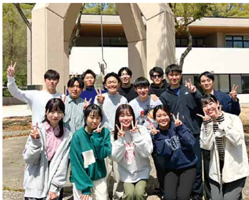
2週にわたる宿泊研修でお互いの距離も縮まり、充実した研修となりました