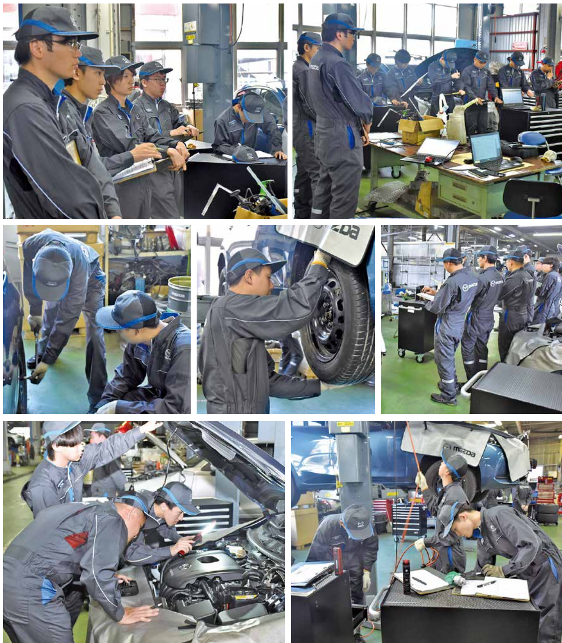
実習車両のMAZDA2で点検整備の実習が行われました

この日の研修では、車両の構造作動の基礎知識を学ぶと共に、MAZDA2で点検整備の実習を行いました。新入社員たちは、点検項目を丁寧に確認しながら真剣な表情で取り組んでいました。