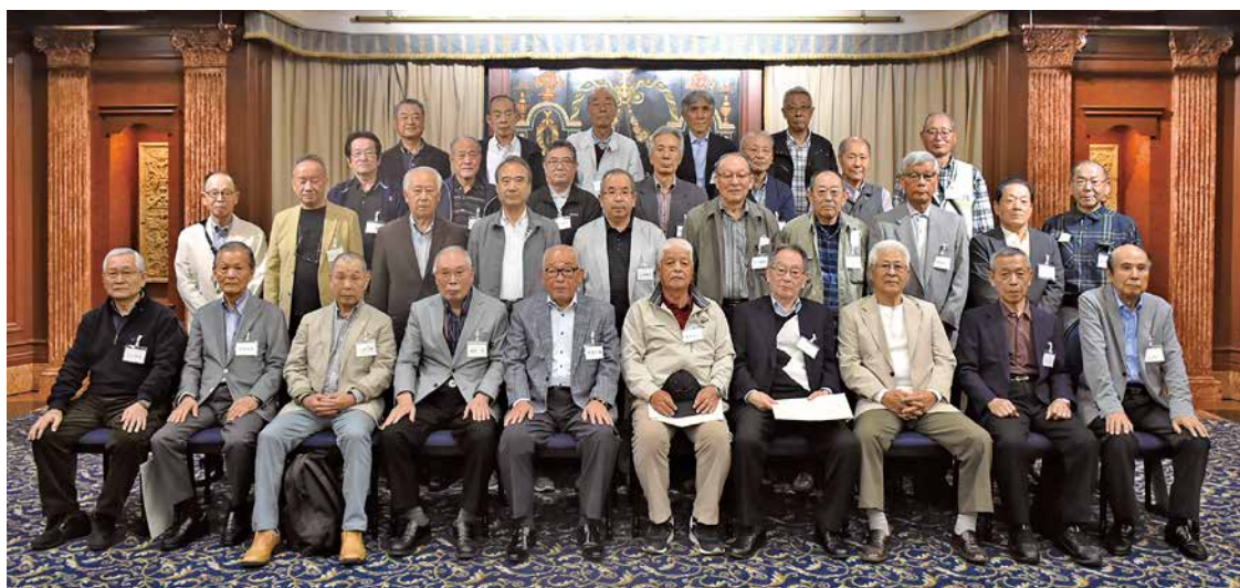
出席者全員で記念撮影