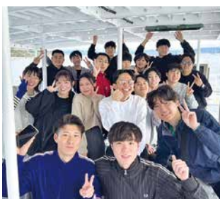
いざ江田島に出発!

2日目は、大縄大会などで身体を動かした後、前日にまとめた企画をそれぞれのチームに分かれて発表し、情報を共有。同期でさまざまな意見を交わし、絆が深まった研修となりました。