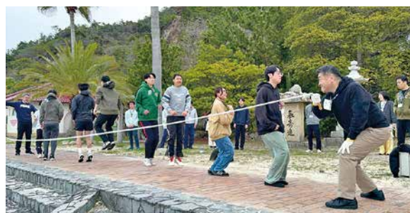
息の合った大縄大会