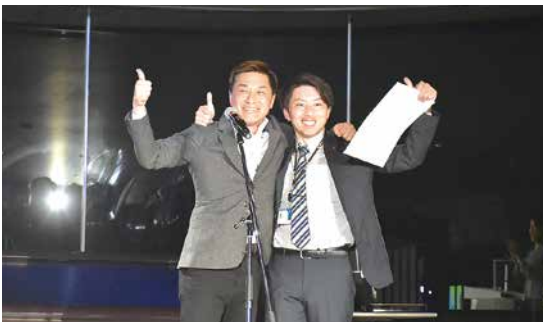
松田会長から表彰（総合1位～3位）

表彰された皆さん、おめでとうございます。保険とは、情熱が物を言うものだと思います。お客様と向き合い、信頼していただけるからこそ実績に繋がります。今日集まった素晴らしい皆さんと共にすべての力を結集し、さらに発展していきたいと思います。