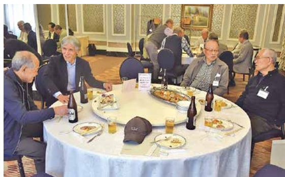
昼食懇親会では、久しぶりの再会に会話がはずみ、なごやかな時間を過ごしました