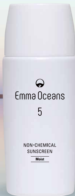
エマ オーシャNZ 5 モイストタイプ [しっとり]