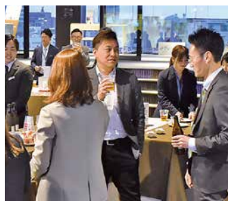
食事を楽しみながら会話がはずみ、店舗間の親睦も深まりました