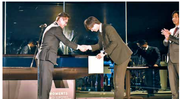
山根社長から表彰（総合4位～6位）