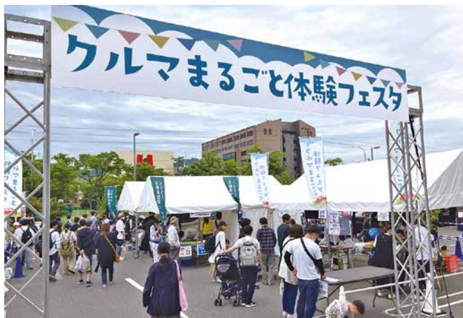
イベント会場入口