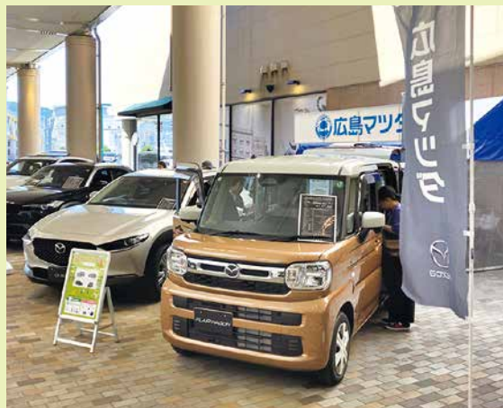
広島マツダブースではCX-60をはじめMX-30、CX-30、フレアワゴン进行展示