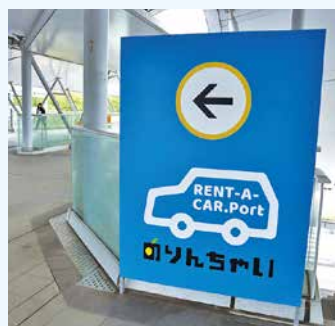
屋根付きの連絡通路で徒歩約5分

マツダレンタカー広島 広島空港店ならではの特典も取り揃えています。ぜひご利用ください！