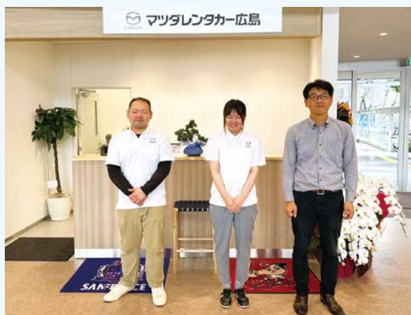
「オンラインワンの選ばれる店舗を目指します！」と上藤店長(右端)

マツダレンタカー広島 広島空港店ならではの特典も取り揃えています。ぜひご利用ください！