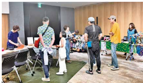
アクションペインティングやコサージュ作り、クルミボタンヘアゴム作りなど充実したワークショップ