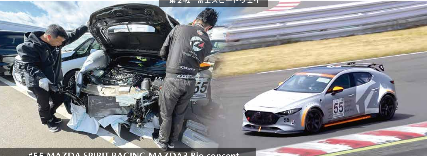
#55 MAZDA SPIRIT RACING MAZDA3 Bio concept

5月24日(金)～26日(日)、ENEOSスーパー耐久シリーズ2024 Empowered by BRIDGESTONE 第2戦が富士スピードウェイ(静岡県)で行われました。シリーズの山場となる今回の「NAPAC 富士 SUPER TEC 24時間レース」では、開催3日間で過去最高の54,700人が来場。レース観戦以外にも楽しめるイベントが充実しており、会場にはキャンプやBBQを楽しむ観客のテントも立ち並びました。