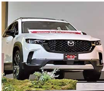
北米仕様専用モデルのCX-50

このほかアクションペインティングやコサージュ作りなどのワークショップ、ミニコンサート、カフェなどアメリカな雰囲気でも盛りだくさんな内容となっており、悪天候にも関わらず多くの来場者で賑わいました。