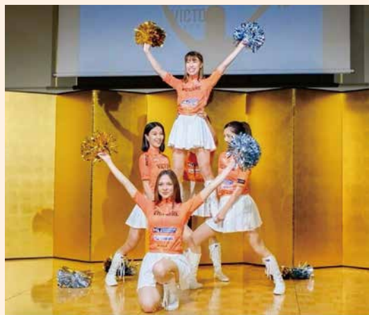
3月のお披露目パーティーでのダンスパフォーマンス

また、自転車ロードレースを盛り上げるために、ヴィクトワール広島のCMがシャレオ中央広場ほか19箇所のデジタルサイネージや、テレビCMで放映されました。