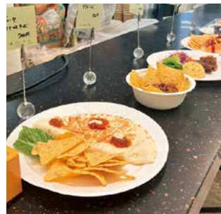
アメリカなカフェメニュー