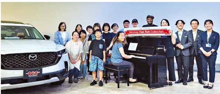
終了後に出展していただいた皆さんと記念撮影