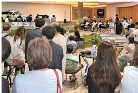
多くの来場者で賑わいました