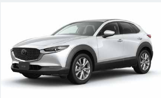
MAZDA CX-30 20S Touring

マツダ㈱はクロスオーバーSUV「MAZDA CX-30」を商品改良し、全国のマツダ販売店を通じて7月18日(木)より販売を開始しました。