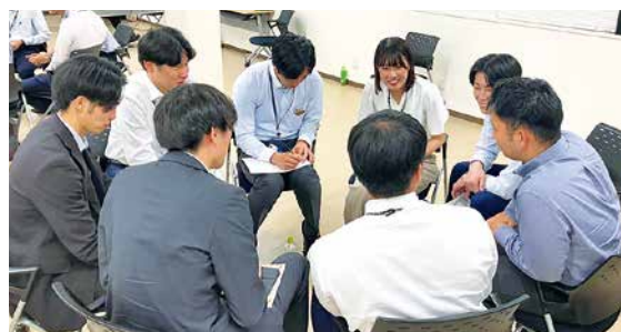
チームごとにオリジナルのミュージカルシーンを創作