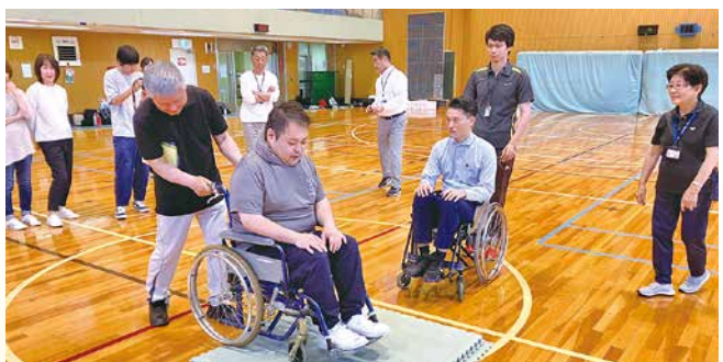
車椅子で移動し、段差などを体験して接し方や介助について理解を深めました