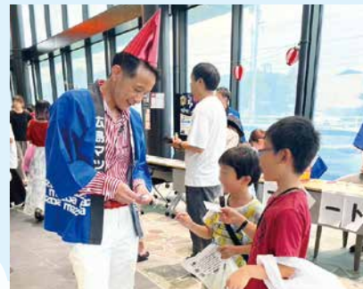
お子様に大人気の道迫店長