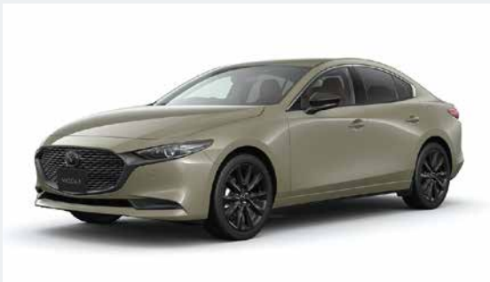
MAZDA3 SEDAN XD Retro Sports Edition

マツダ㈱は「MAZDA3」を商品改良し、全国のマツダ販売店を通じて8月1日(木)より予約受注を開始しました。販売開始は10月上旬を予定しています。