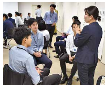
「自分の殻を破る」セッションでは、コミュニケーションの原則原則や表現のポイントを体感的に学びました