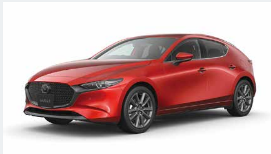
MAZDA3 FASTBACK 20S Touring