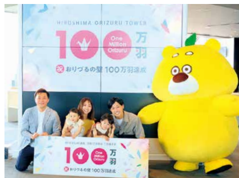
セレモニー記念撮影