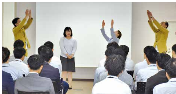
ミュージカルシーンを鑑賞し、研修テーマを共有

研修には各店舗から合計48名が参加。プロの俳優が相手となり緊張感ある場面を体験することで、マニュアルでは通用しないリアルな場と向き合い、本気で向き合うことやチームで協創することの大切さを学びました。