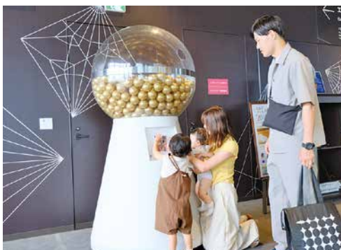
巨大カプセルトイ