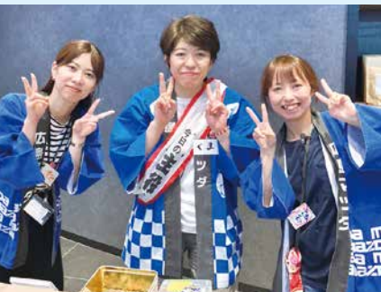
スタッフの皆さんお疲れさまでした！