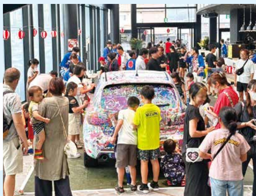
雨天にもかかわらず大盛況！

雨の影響でオープニングが一部中止となりましたが、多くの来場者で会場には笑顔があふれ、夏の思い出として大変ご好評いただけ一日となりました。