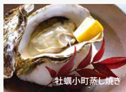
牡蠣小町蒸し焼き