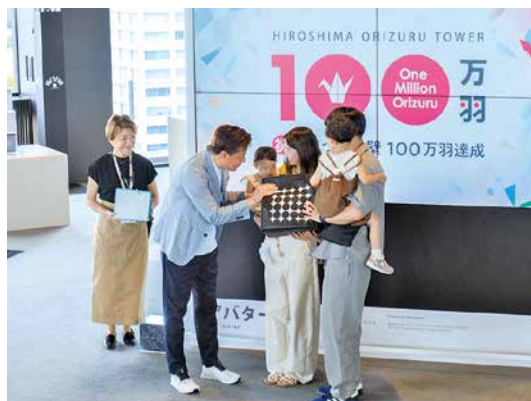
松田会長から記念品が贈呈されました

なお、12階「おりづるの広場」には巨大カプセルトイが設置され、おりづるの壁体験者先着1000名様を対象としたイベントも開催されました。