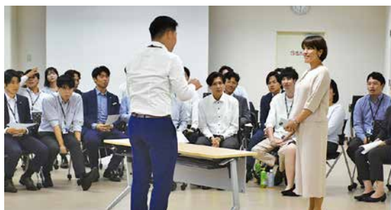
プロの俳優を相手に緊張感のある場面を体験