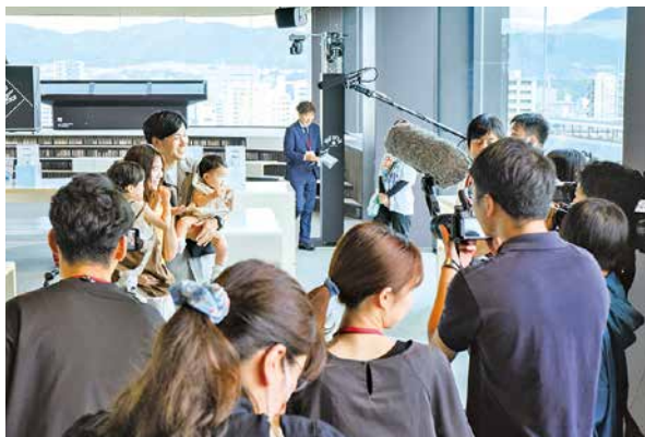
報道関係各社の取材も入りました