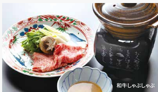
和牛しゃぶしゃぶ