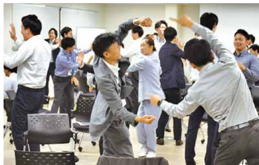
心と身体を使ったワーク