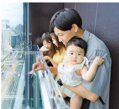
おりづるの壁に投入