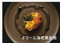
オマール海老黄金焼

特別な時間を過ごすことができる「厳島いろは」。グループ社員の皆様には宿泊料金30%OFFの特典をご用意しています。 ※ダイナミックプライシングのため、正確な金額はお申込みの際、宿へご確認ください。