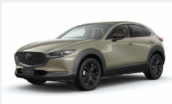
MAZDA CX-30 20S Retro Sports Edition