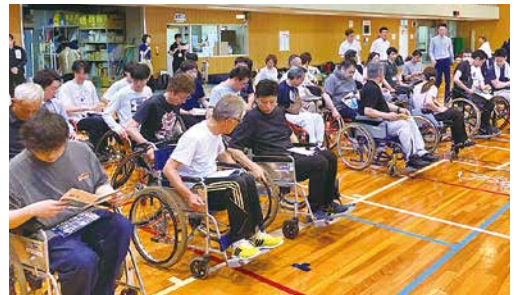
車椅子利用者への配慮を学びました