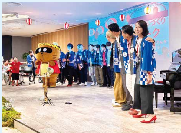
多彩な催しの音楽ステージ