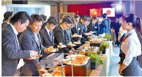
握手カフェのケータリングサービス