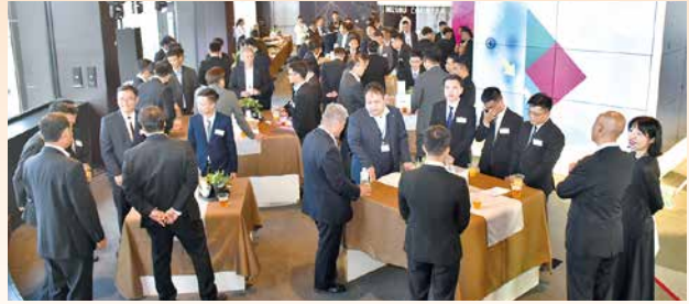
総勢71名が参加して歓迎会が開催されました

会場では日本で新たなスタートを切る第4期生32名の晴れの門出を共に祝い、親睦を深めました。