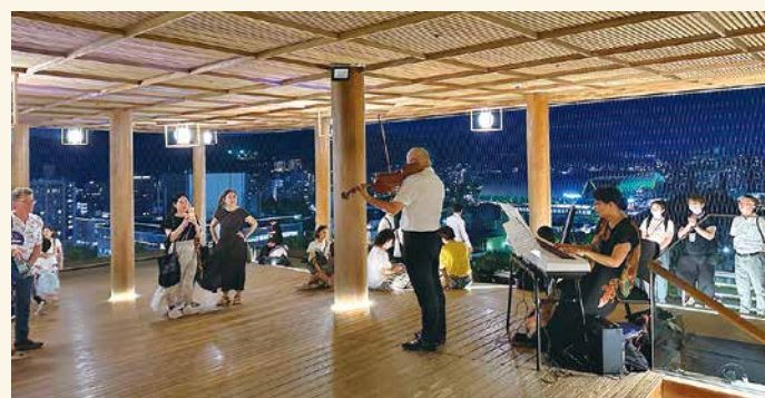
多くの人で賑わう展望台で、平和への祈りを込めた世界へのメッセージを奏でました