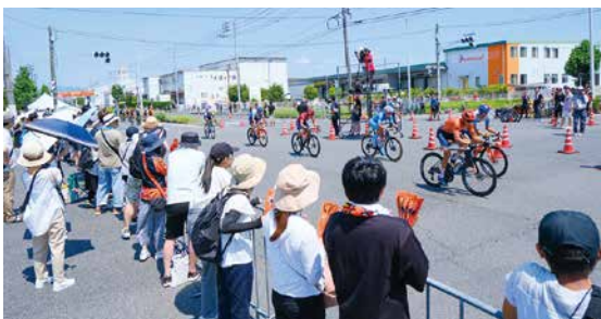
沿道からも多くの観客が声援を送りました