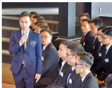
新入社員1人ひとりが決意表明