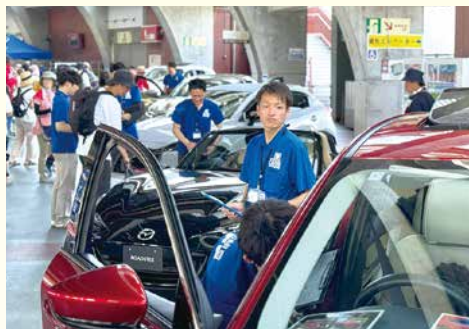
コンコース内にマツダ車を展示してPR