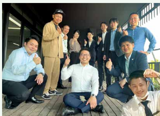
広島マツダ労働組合のメンバー

今回のジャンボリーには過去最多の参加者が集まり、子供から大人まで楽しめるレクリエーションや大ビンゴ大会、フィナーレを飾る花火などで大いに盛り上がりました。運営に携わった皆様、大変お疲れ様でした！