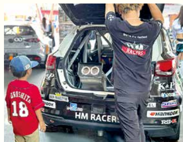
幅広い年代のお客様から注目を集めるHM RACERSのレースカー