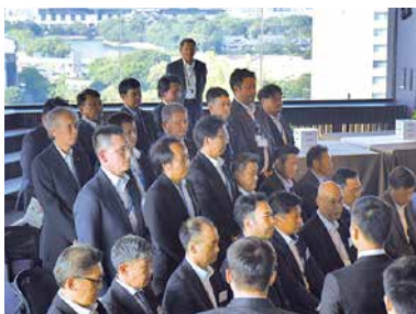
役員・管理職紹介