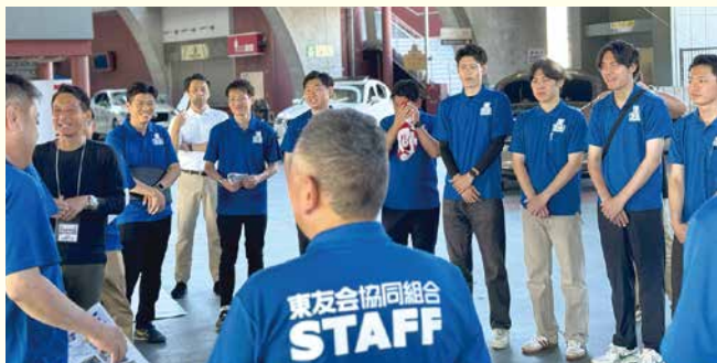
開場前のスタッフミーティング

当日は最高気温36.7度の猛暑の中、揃いのポロシャツ姿のスタッフがマツダ車の魅力をPR。レースクイーンも華を添え、終日多くの家族連れや幅広い年齢層の来場者で賑わいました。