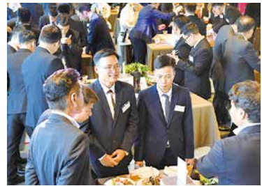
各テーブルで会話もはずみました