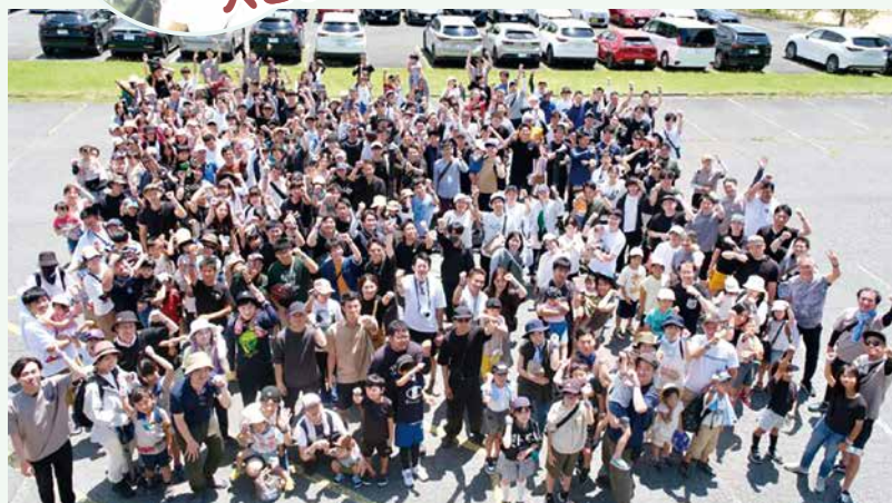
史上最多となる350名の参加者が集まりました