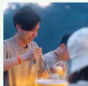
オシャレなデザートコーナー