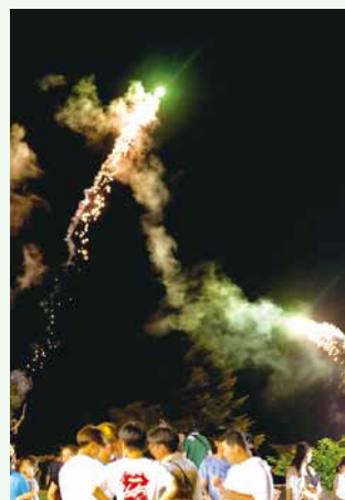
締めくくりの花火