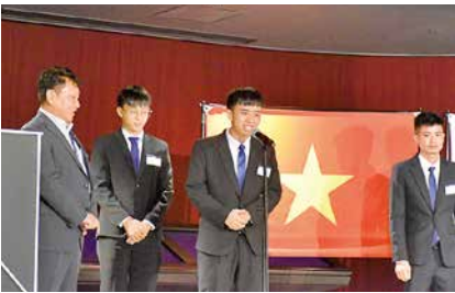
ステージから笑顔で挨拶する新入社員