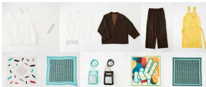
全8アイテムの中から自由に選び、自分らしいスタイルに

握手カフェオーガニックのエプロンには、回収したペットボトルや繊維屑などからリサイクルされたポリエステル繊維の「エコペット」を使用。瀬戸内レモンを意識した優しい黄色で、地球環境にも配慮したユニフォームです。