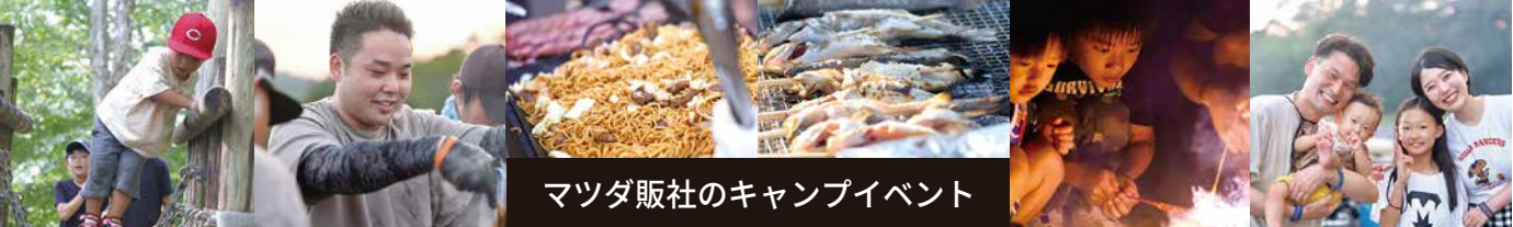
マツダ販社のキャンプイベント