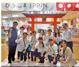
おりづるタワープロデュース「ひろしまIPPIN」