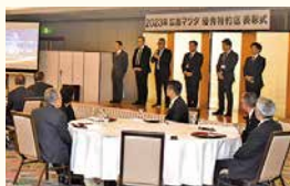
広島マツダ優秀特約店表彰式