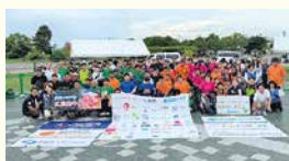
車椅子ソフトボール&フレンドリーマッチ