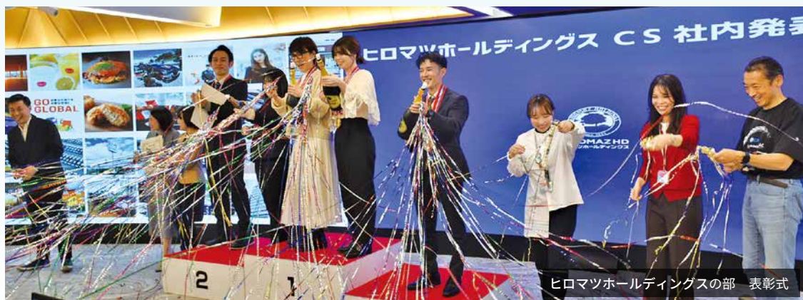
ヒロマツホールディングスの部 表彰式