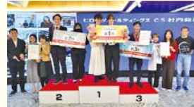
CS社内発表大会(ヒロマツホールディングス)