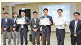
ウォークアラウンドコンテスト