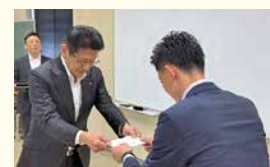
新入社員辞令交付式