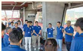
来て見て乗ってみんな祭