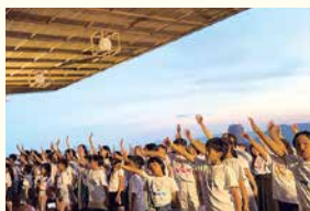
おりづるタワーで平和への願いを込めたコンサートイベント