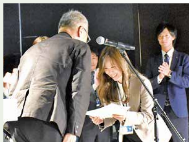
赤井本部長から表彰 （総合7位～10位）