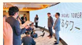
おりづるタワー最新のプレゼンテーション・ルーム