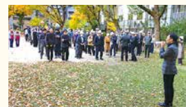
幟町本社ビルで自衛消防総合訓練