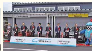
マツダレンタカー広島 広島空港店オープン式典