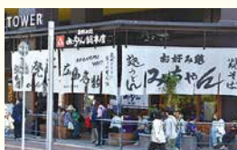
みっちゃん総本店おりづるタワー店