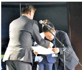
芦谷取締役から表彰 （総合10位以下カテゴリ1位）