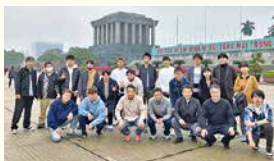
90周年報奨旅行 ベトナム・ハノイ5日間の旅