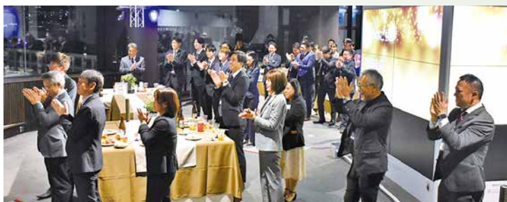
食事を楽しみながら歓談が続き、店舗間の親睦も深まりました