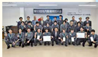
社内整備競技大会