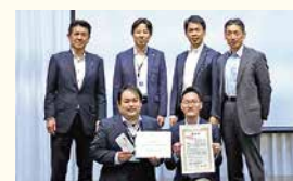
全国マツダ販売店協会中四国支部マツダエクセレントショップ事例発表大会