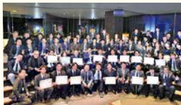
自動車保険キャンペーン表彰式