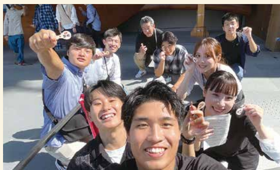
Cチーム (サポート：萩森部長)