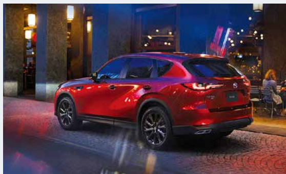
MAZDA CX-60 XD SP

マツダ(株)は、クロスオーバーSUV「CX-60」を商品改良し、全国のマツダ販売店を通じて12月9日(月)より予約受注を開始しました。販売開始は2025年2月21日(金)を予定しています。