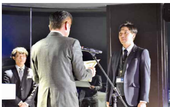
山根社長から表彰（総合4位～6位）