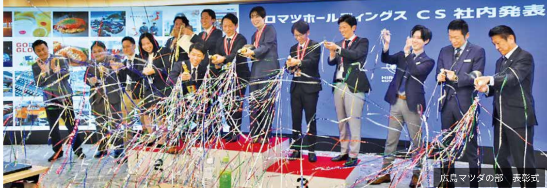
広島マツダの部 表彰式

審査の結果、広島マツダ部門の第1位には昨年に続いて福山東店が、ヒロマツホールディングス部門の第1位にはザ・ステージが選ばれました。表彰された皆さん、おめでとうございます。