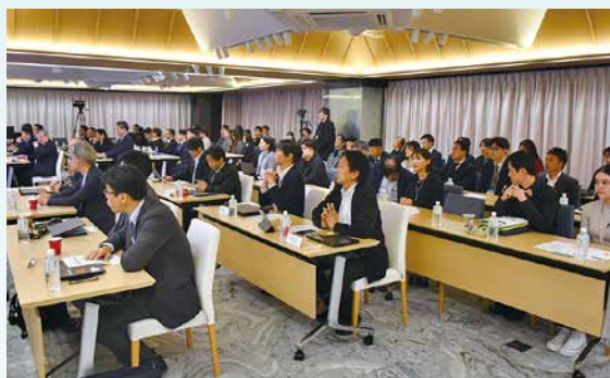
リニューアルされたばかりの2045 Future Presentation Roomで1年間の取組みを発表しました