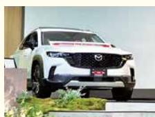
西条店でCX-50を特別展示