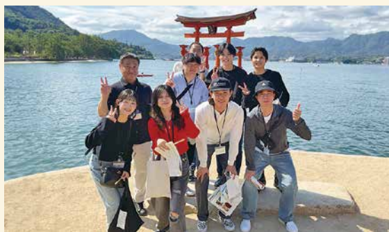
Dチーム (サポート：芦谷取締役)