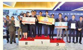
CS社内発表大会(広島マツダ)