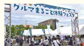
クルマまるごと体験フェスタ2024 in LECT