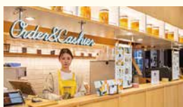
握手カフェオーガニック