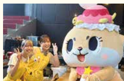
おりづるタワー8周年記念イベント