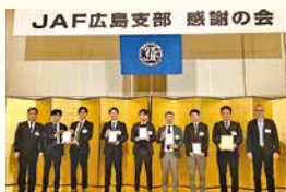
JAF広島支部感謝の会