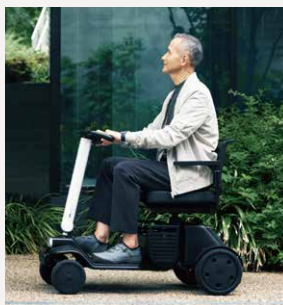
WHILL Model R