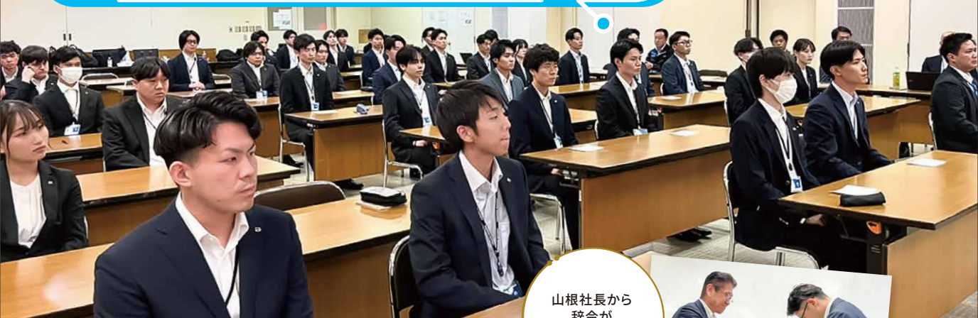
山根社長から 辞令が 手渡されました