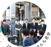
2025年入社の皆さんも発表