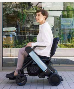
WHILL Model F