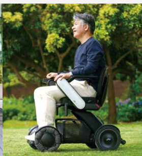
WHILL Model C2