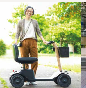
WHILL Model S